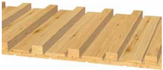
Variante 3: 1x 21x96 mm, 1x 40x68 mm