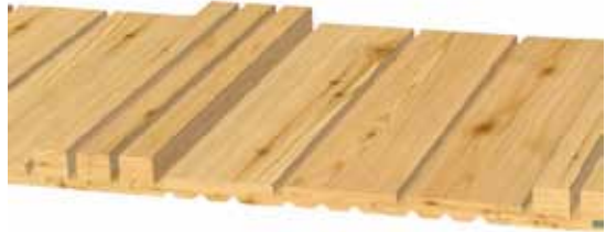
Variante 1: 3x 40x68 mm, 3x 21x146 mm