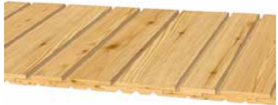
Variante 2: 1x 21x96 mm, 1x 21x121 mm, 1x 21x146 mm